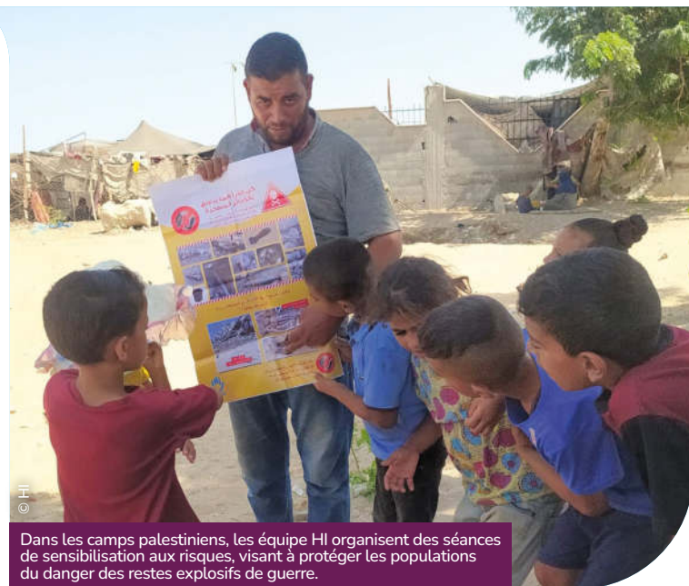
Dans les camps palestiniens, les équipes HI organisent des séances de sensibilisation aux risques, visant à protéger les populations du danger des restes explosifs de guerre.

En devenant marraine ou parrain, vous aidez à financer des séances de soutien psychosocial pour 8 personnes pendant 1 an.