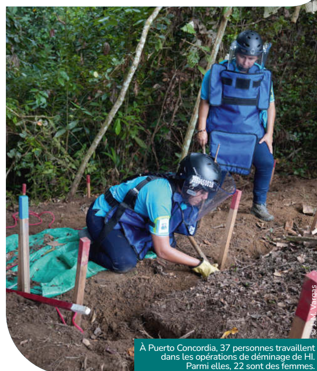
À Puerto Concordia, 37 personnes travaillent dans les opérations de déminage de HI. Parmi elles, 22 sont des femmes.